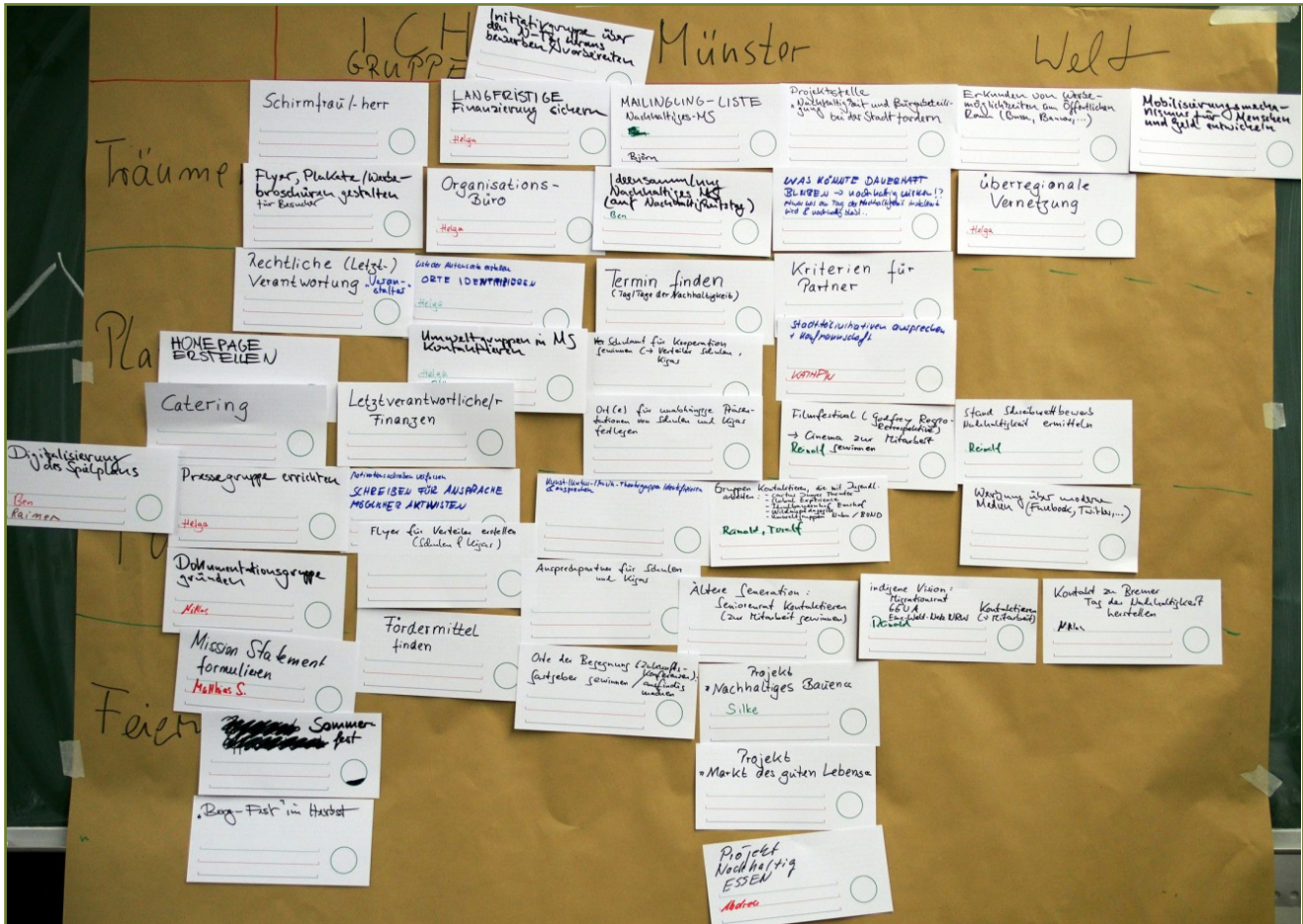
Abbildung 2: Spielplan der Initiative

mehr zu konsumieren, autofrei zu leben und Arbeitsplätze in Wohngebiete zu verlagern, um die räumliche Trennung von Wohnen und Arbeiten aufzuweichen. Weitere Ideen waren, die Straßen an diesem Tag nur für Fahrräder bereitzustellen bzw. den Rückbau von Straßen zu forcieren und