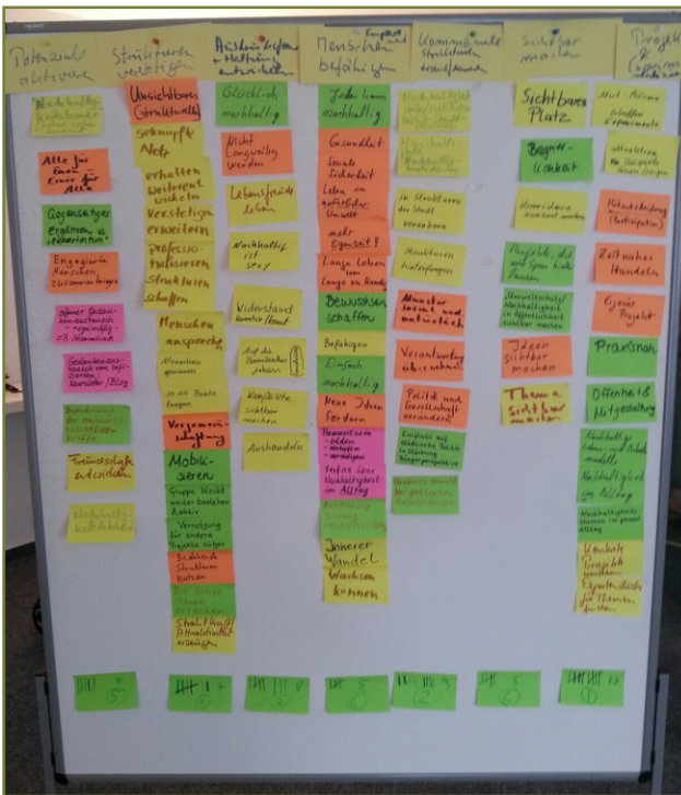
Abbildung 3: Ergebnis des Verstetigungsworkshops

indem Politiker*innen die Möglichkeit hatten untereinander oder mit Bürger*innen ins Gespräch zu kommen, erarbeitet und später auch umgesetzt.