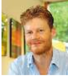
Schirmherr: Christian Felber

die vierten Nachhaltigkeitstage stehen unter dem Motto „Genug. Für alle. Für immer.“ Akteur*innen aus Verwaltung, Wissenschaft, Initiativen, Unternehmen und Zivilbevölkerung zeigen im gesamten Stadtgebiet vorbildliche Lebensstile für die Zukunft auf. Sie veranstalten Mitmach-Aktionen, Workshops, Vorträge und Musik für Groß und Klein. Die Themenpalette reicht von der solidarischen Landwirtschaft über umweltfreundliche Mobilität bis zur ethischen Geldanlage. Ihr könnt euch von neuen Ideen inspirieren lassen, in den Dialog treten und nachhaltige Konsumstile ausprobieren.